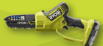
Élagueur à main guide 15 cm 18V ONE+ HP™ RY18PSX15A-0 RY18PSX15A-120