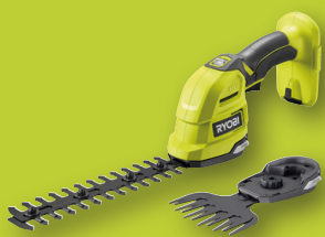
Cisaille/sculpteur "2-en-1" 18V ONE+™ RY18GSA-0

4 nouveaux outils astucieux et ultra-pratiques dans la gamme 18V ONE+™ :