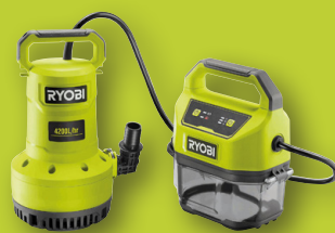
Pompe d'évacuation 18V ONE+™ RY18SPA-0