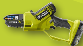
Élagueur à main guide 10 cm 18V ONE+™ RY18PSX10A-0 RY18PSX10A-120