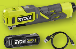
Gonfleur 4V USB Lithium RI4-120G

Compacts et nomades, les outils de la gamme s'intègrent à ces quatre univers Ryobi® : bricolage, loisirs créatifs, nettoyage et loisirs extérieurs.