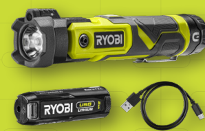
Lampe torche 4V USB Lithium RLP4-120G