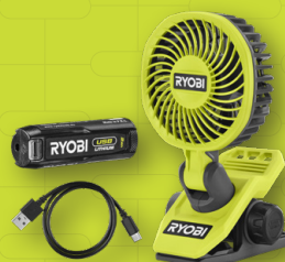
Ventilateur sur pince 4V USB Lithium RCF4-120G