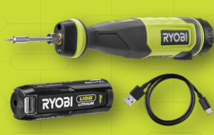
Fer à souder 4V USB Lithium RSI4-120G