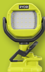
Lampe sur pince 18V ONE+™ RLCL18