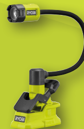
Lampe avec corps flexible 18V ONE+™ RLCF18