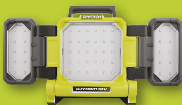
Triple panneaux lumineux LED hybride 18V ONE+™ RLPH18