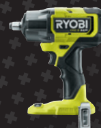
Boulonneuse à chocs Brushless 18V ONE+ HP™ RIW18X-0