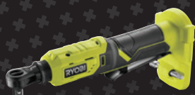
Clé à Cliquet 3/8" 18V ONE+™ R18RW3-0