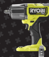
Boulonneuse à chocs Brushless 18V ONE+ HP™ RIWH18X-0